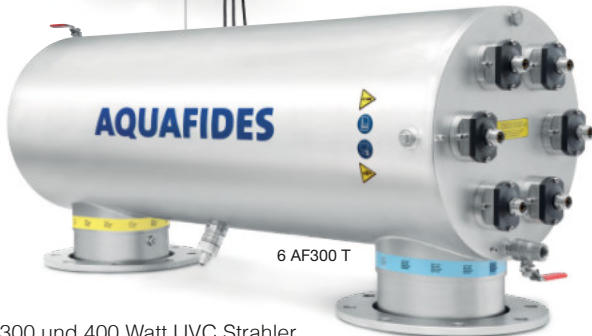
6 AF300 T

Die AQUAFIDES DigiSys-Steuerung ermöglicht die komfortable und übersichtliche Bedienung sämtlicher Funktionen