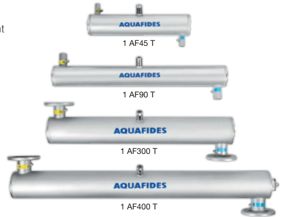
1 AF45 T